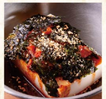
양념 두부 ¥429