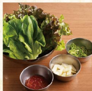
(가릭라이스, 청고추, 상추된장) 상추세트 ¥759