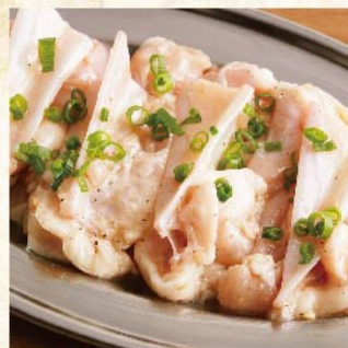
기름진 야겐 (연골) 소금 ¥539