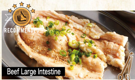
Beef Large Intestine