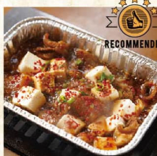
소힘줄과 두부조림 ¥759