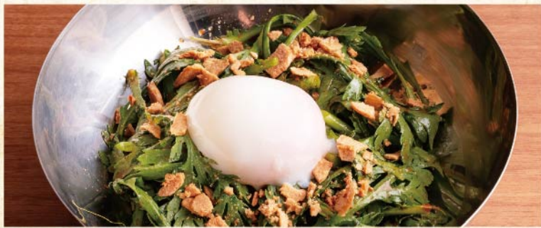
썩갓 샐러드 ¥649