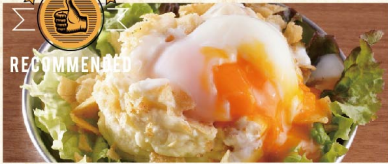
후타고 감자 샐러드 ¥649