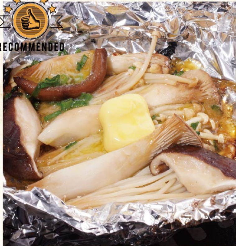
버섯버터 호일구이 ¥649