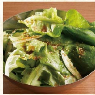
후타고 소금 샐러드 ¥539