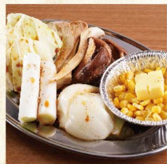
야채구이 모듬 ¥759