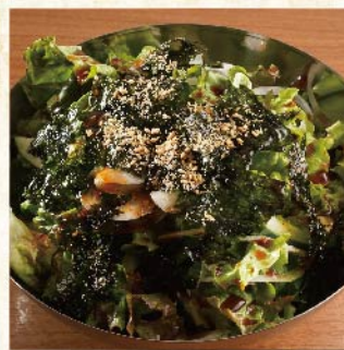
재래기 샐러드 ¥539