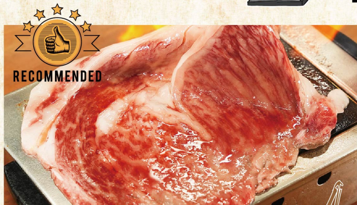
名物!! 特大黑毛和牛牛五花 ¥1,859