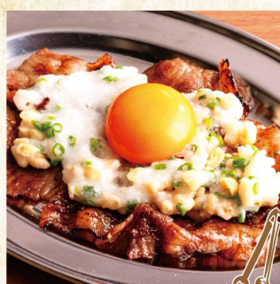
烤和牛腩 (一枚) ¥1,529