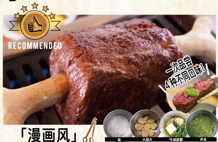
「漫画风」特大西冷牛排 ¥4,059