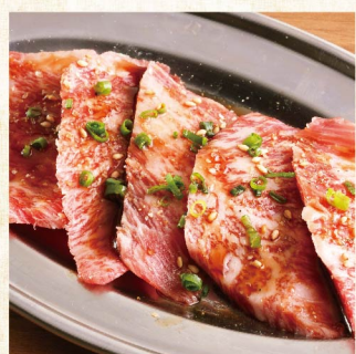
黑毛和牛牛五花肉 ¥869