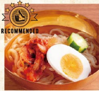
名物!! 特制冷面 ¥539