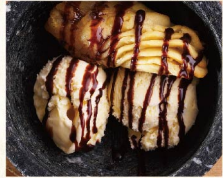
香草冰淇淋配甜薯 ¥539