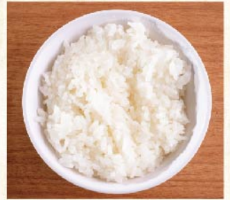
饭 [S] ¥220 [M] ¥275 [L] ¥385