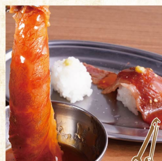
喜烧牛五花肉 配蛋黄寿喜烧酱汁 ¥429