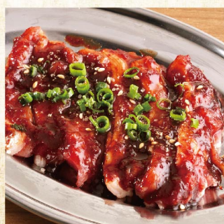
极品黑毛和牛牛五花肉 ¥759