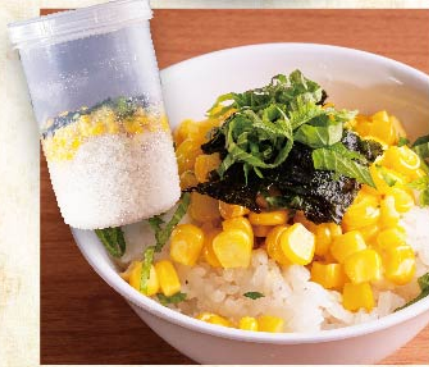
셰이크 주먹밥 (시소와 옥수수)