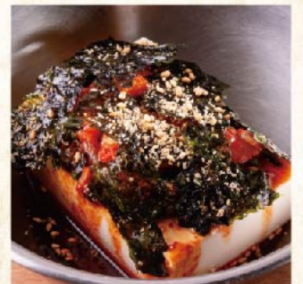
양념 두부 ¥429