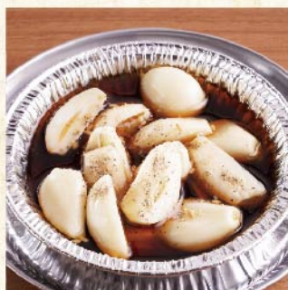
아오모리현산 마늘 호일구이 ¥539