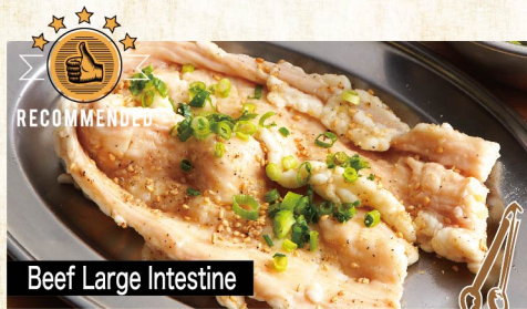
Beef Large Intestine