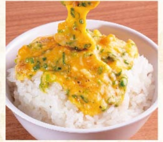
참마 덮밥 ¥539