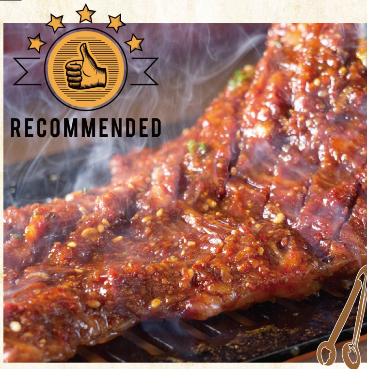
튀어나오고 싶은 하라미 (안창살)