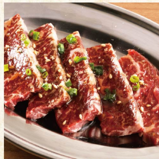
하라미 (안창살) ¥1,199