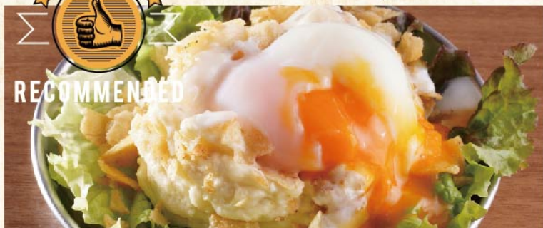
후타고 감자 샐러드 ¥649