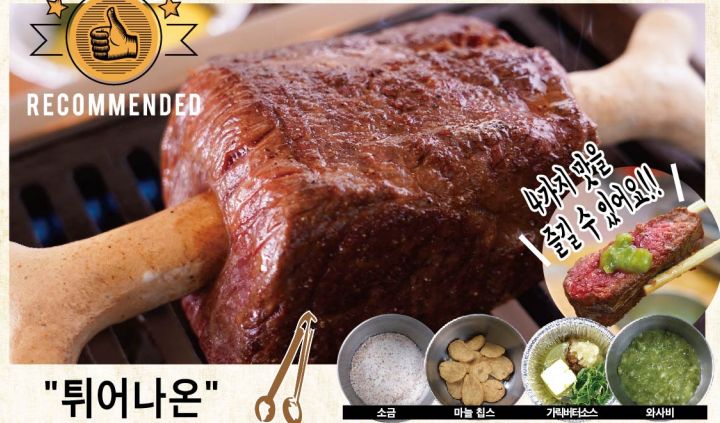
"튀어나온" 만화고기 ¥4,059