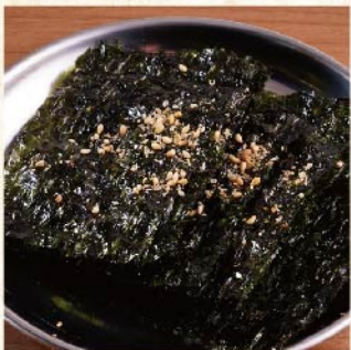
한국 김 ¥429