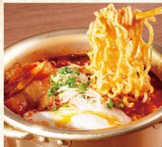
매운 라면 ¥759