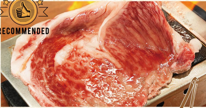
명물!! 흑모와규의 "튀어나온" 갈비 수량 한정!! 약 250g 갈비 등심 ¥1,859