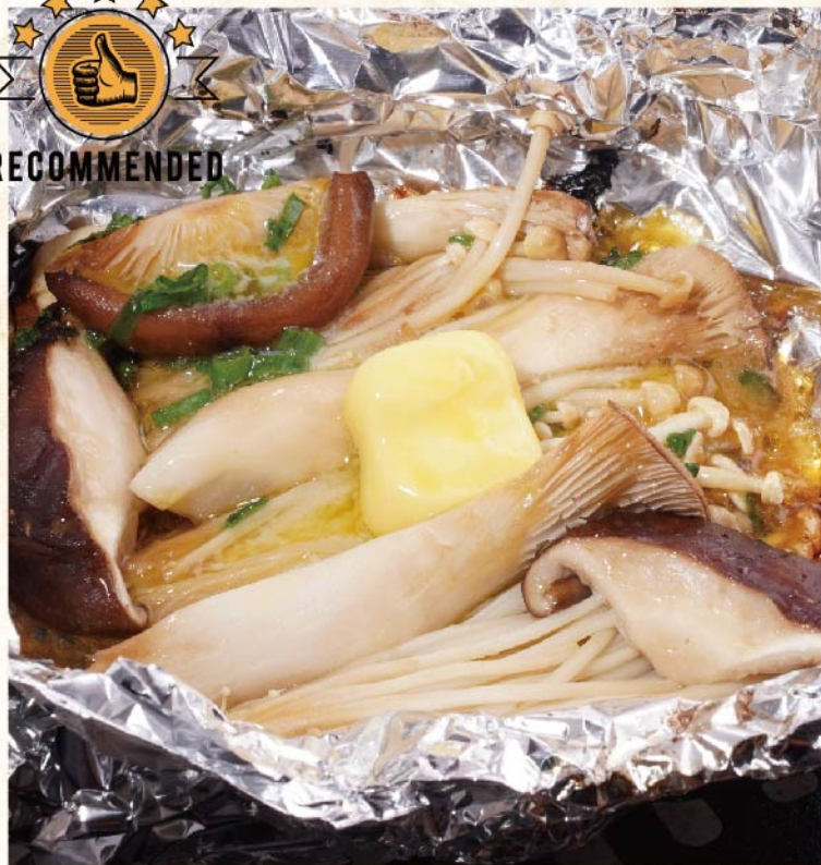
버섯버터 호일구이 ¥649