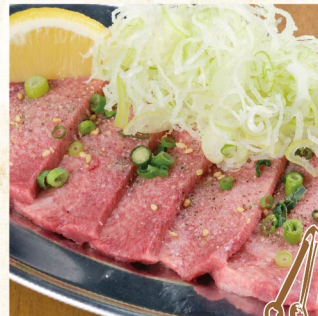
P상급 파 우설 소금 ¥1,529