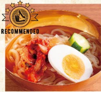
명물!! 엄선 한입냉면 ¥539