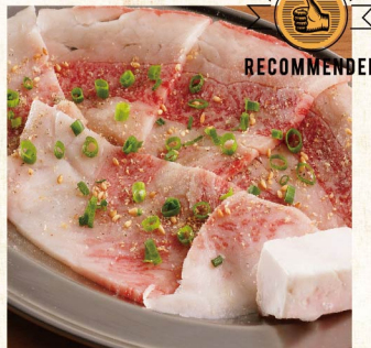
구운 샤브샤브 갈비 ¥814