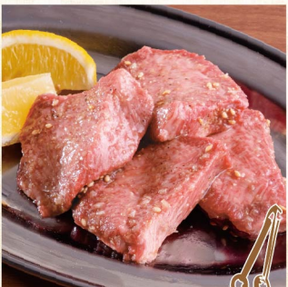
특급 두껍게 썬 우설 ¥2,739