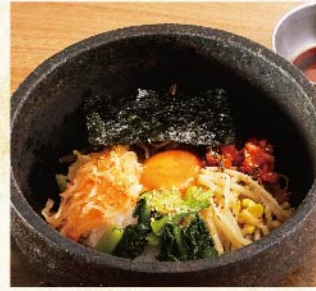
돌솥 비빔밥 ¥1,089