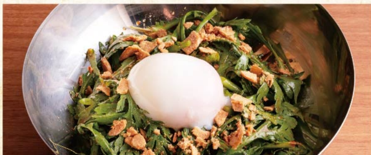
썩갓 샐러드 ¥649