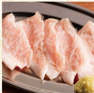
톤토로 향정살 와사비 ¥539