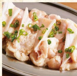
기름진 야겐 (연골) 소금 ¥539