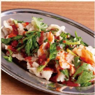
아키짱 회 ¥539