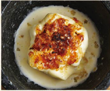
후타고 아이스크림 ¥539