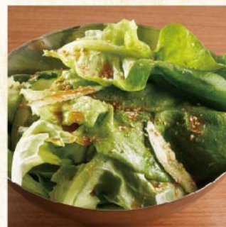
후타고 소금 샐러드 ¥539