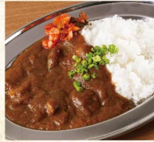
흑모와규 소힘줄 카레 ¥759