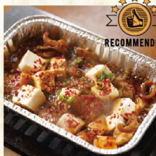
소힘줄과 두부조림 ¥759