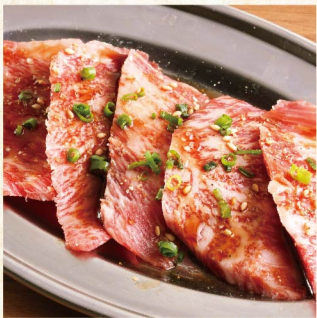
흑모와규 갈비 ¥869