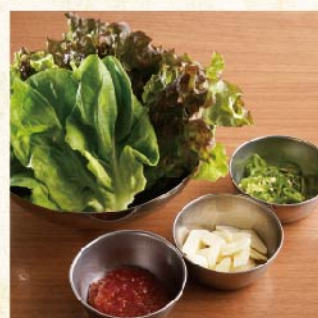
(가릭라이스, 청고추, 상추된장) 상추세트 ¥759