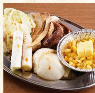
야채구이 모듬 ¥759