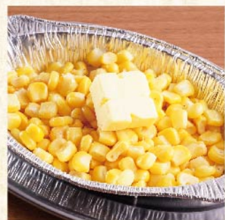
콘버터 호일구이 ¥429