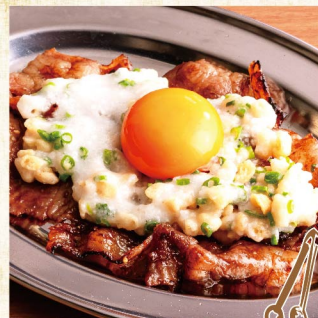
와규구이(닭알,참마, 텡카스와 함께) ¥1,529