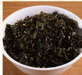
불고기 전용 밥 ¥429