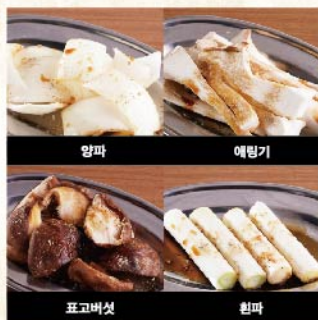
야채구이 단품 ¥429