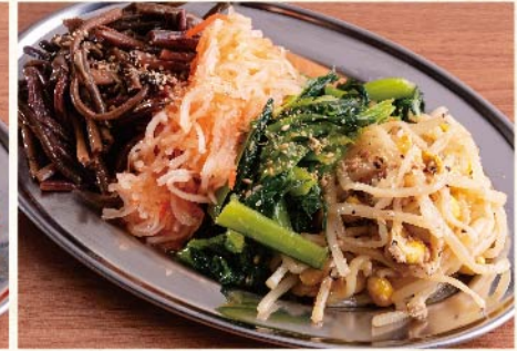
나물 모듬 S¥759 L¥979