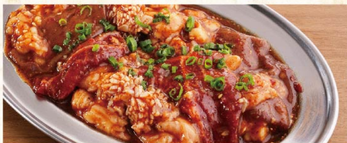
호르몬 모듬(쇠고기와 돼지고기) ¥1,529