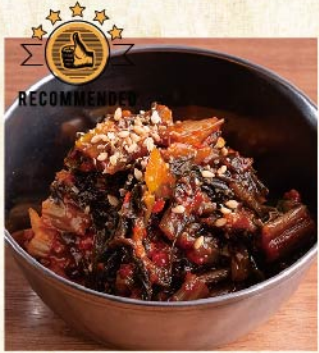
명물!! 반죽음김치 ¥539