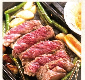
자부톤 로스 (희소부위 목심살) ¥2,189