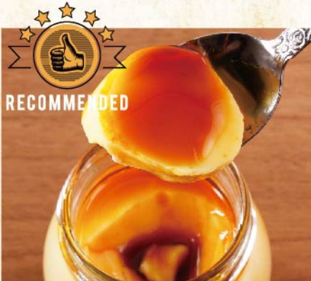
금단 푸딩 ¥539