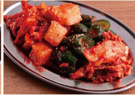
김치 모듬 S¥759 L¥979