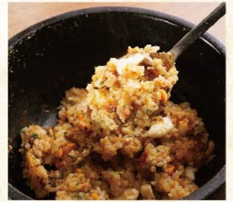
후타고 가릭라이스 ¥979