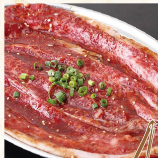
밀피유 로스 ¥1,859