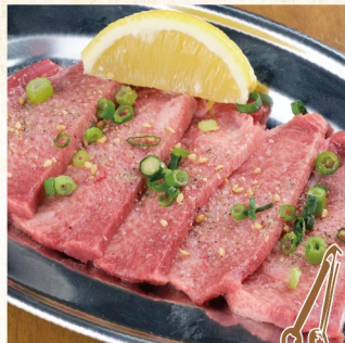
상급 우설 소금 ¥1,485