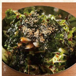
재래기 샐러드 ¥539