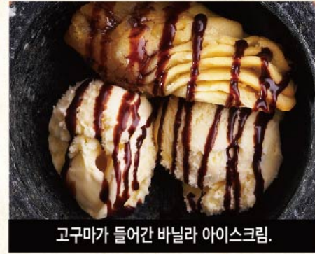
고구마가 들어간 바닐라 아이스크림.