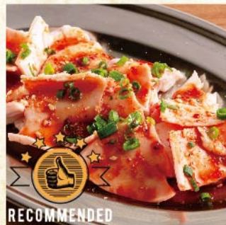
꼬들꼬들 구이 ¥539