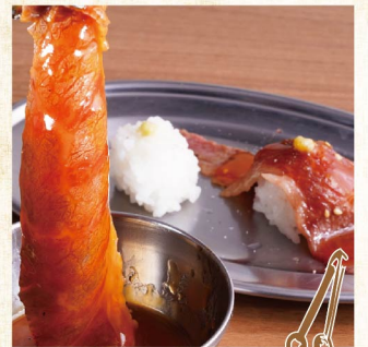
스키야키 갈비 너와 함께... ¥429