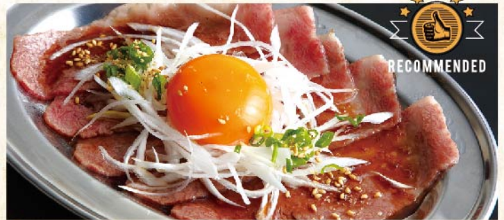
구은 생계란 회 ¥1,199