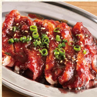
흑모와규의 중독갈비 ¥759