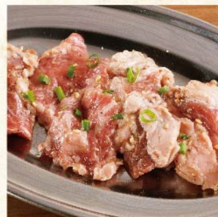
환상의 하라미 (안창살) ¥539