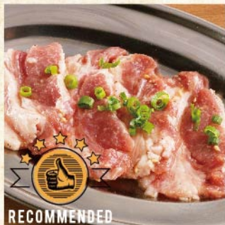
멈추지 않는 턱살 ¥539