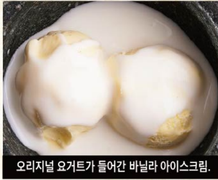
오리지널 요거트가 들어간 바닐라 아이스크림.