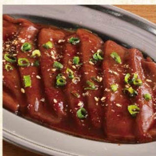
신선 레버 ¥429