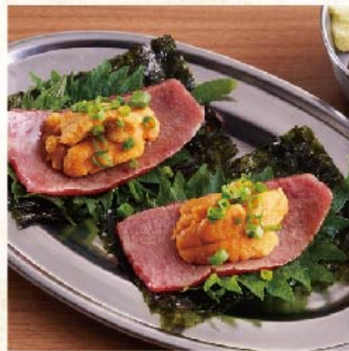
고기성게회 (1장) 1장¥649 *2장부터 주문 가능